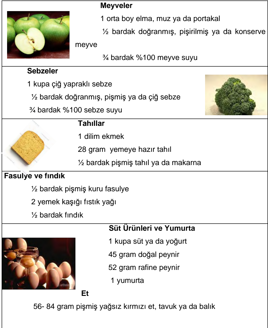
Tablo 2: Bir defada (serviste) alınacak yiyecek miktarı